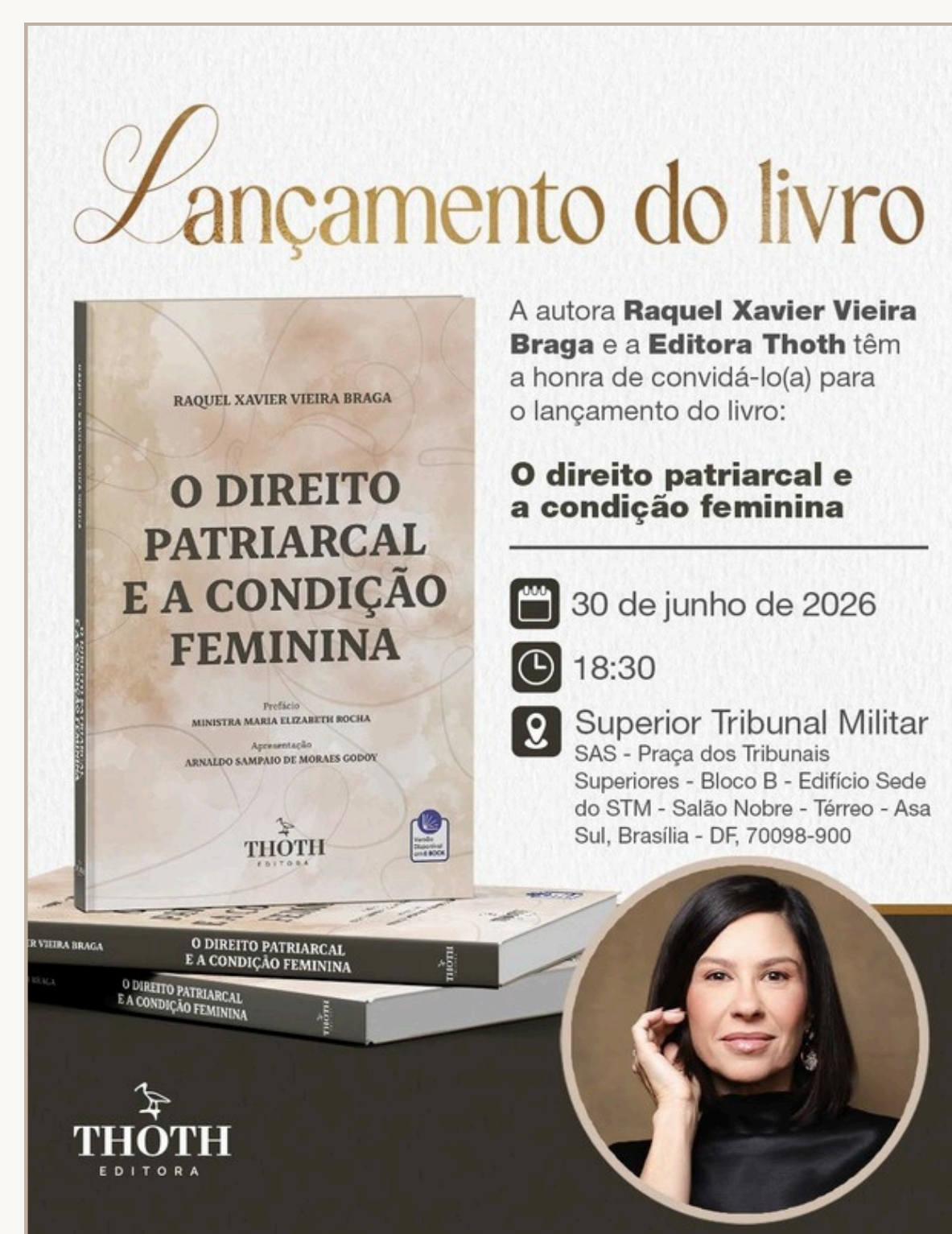
O Direito Patriarcal e a Condição Feminina