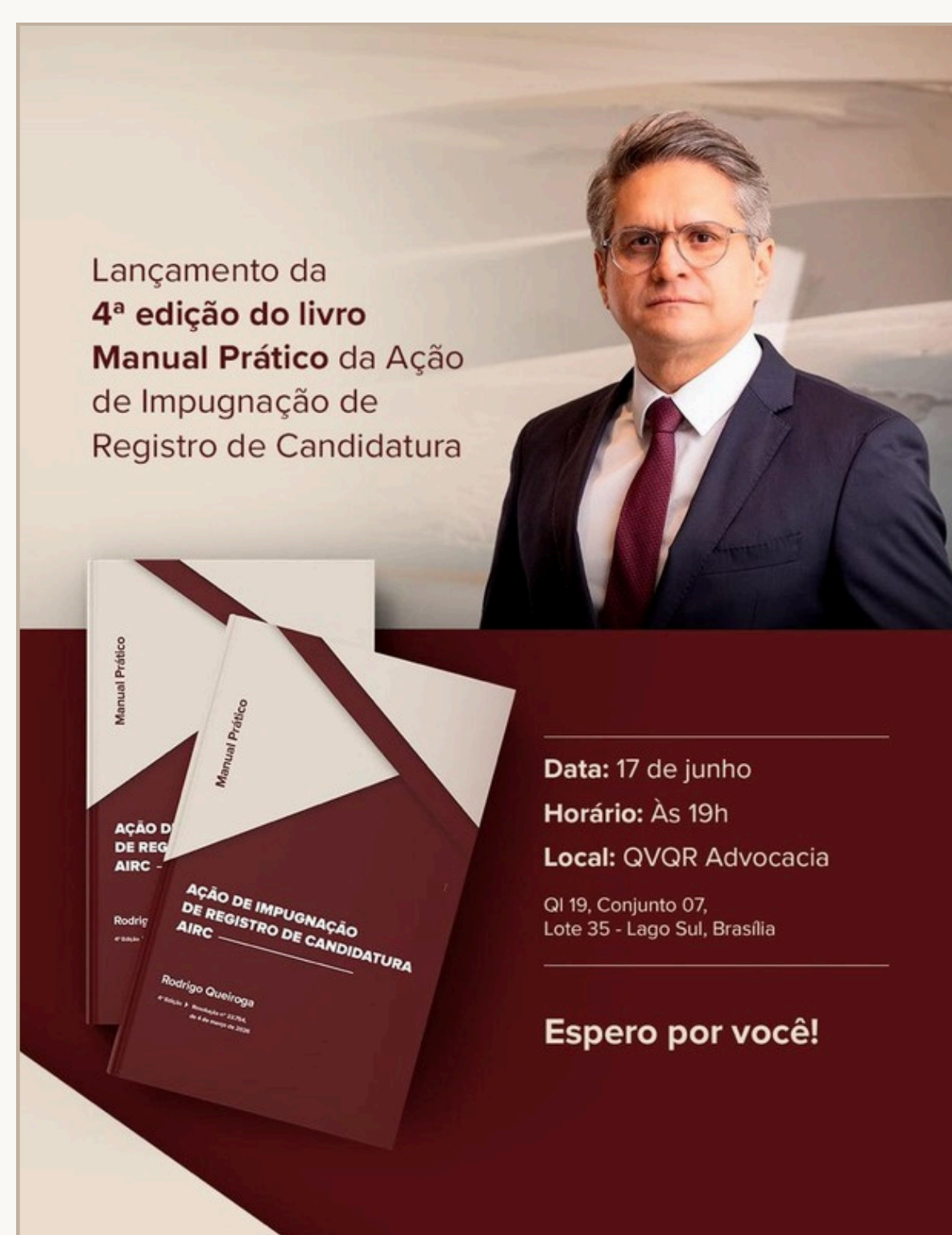
Manual Prático da Ação de Impugnação de Registro de Candidatura

O IADF tem a honra de divulgar as obras recentemente publicadas por seus associados, contribuindo para o enriquecimento do pensamento jurídico.