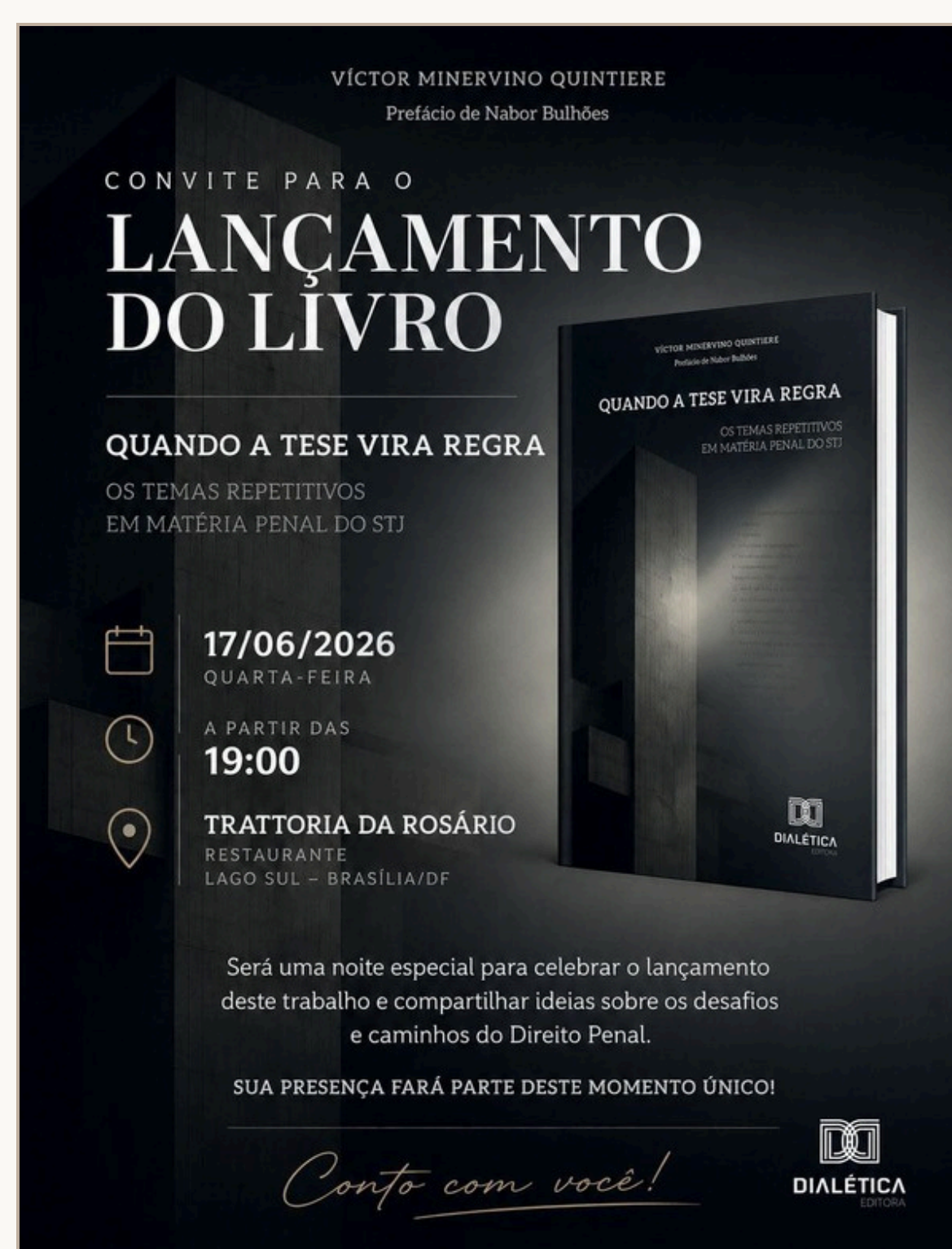
Quando a Tese Vira Regra